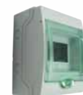
Tableau de sélection

Inclus toutes les protections électriques nécessaires : (disjoncteur courbe D + 30 mA).